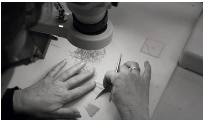
Même si tout est fait pour produire sans défaut, le contrôle reste une étape importante pour une prestation globale de qualité. Selbst wenn alles daran gesetzt wird, um eine fehlerlose Produktion zu gewährleisten, bleibt die Prüfung eine wichtige Etappe, damit eine hochwertige Globaldienstleistung sichergestellt ist. Even if everything is done to produce flawless, the control remains an important step for a comprehensive quality delivery.