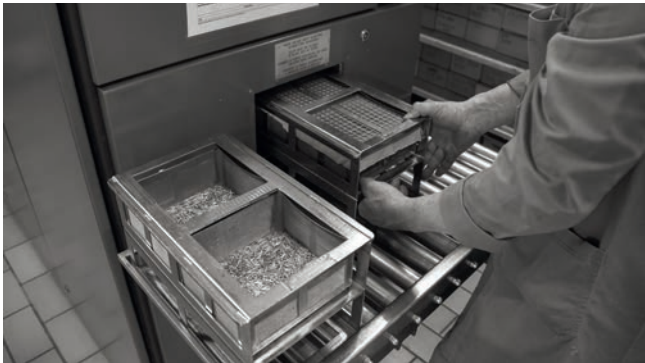
Roger Maeder SA dispose d'une installation de lavage Pero très efficace. Die Roger Maeder SA verfügt über eine sehr effiziente Pero-Reinigungsanlage. Roger Maeder SA relies on a very effective Pero washing facility.

The machines of the two companies are of different types, if Polydec rests exclusively on NC sliding-head lathes and Escomatic machines, Maeder has a pool of cam auto machines and just ordered its first NC machines with the acquisition of two SwissNano. The Director tells us: "We were favorably impressed by the SwissNano and we thought it was time to move to the CN, the overall dimensions of the machine and its kinematic seem ideal for the production of parts such as ours. The arrival of Polydec has allowed us to invest faster".